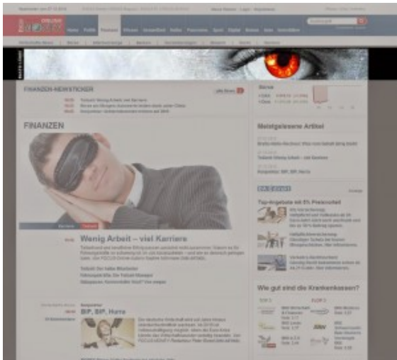
Ejemplo de Anuncio Sidekick

Interstitials : es un tipo de banner cuya dimensión es de 800×600 pixeles por lo que ocupa toda la ventana del navegador . Se denomina interstitial porque suele aparecer entre un clic y una descarga de la página de destino . Por sus dimensiones, sin dudas, llama la atención, sin embargo resulta ser intrusivo.