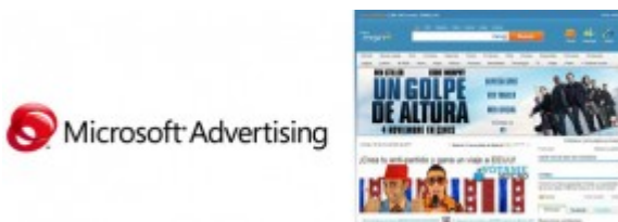
Ejemplo de Anuncio Billboard

Billboard : se trata de un formato de amplias dimensiones (970x250 pixeles) que por lo tanto tiene gran visibilidad y que ofrece a los anunciantes gran notoriedad y un alto grado de interactividad . Cuando se estrenó en la web de Microsoft, este formato provocó muchas interacciones positivas como expandir la creatividad , abrir el sonido , ver el vídeo de nuevo ; y muy pocos usuarios cerraron el billboard.