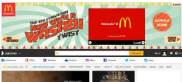
Ejemplo de Anuncio Custom Header

Custom header : es el encabezado de la página web, blog, entre otros que sirve para anuncios publicitarios.