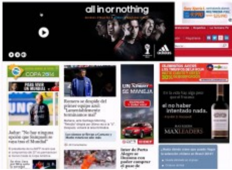
Ejemplo de Banner Expandible

Custom header : es el encabezado de la página web, blog, entre otros que sirve para anuncios publicitarios.