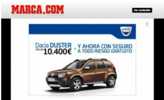
Ejemplo de Anuncio Interstitial

Interstitials : es un tipo de banner cuya dimensión es de 800×600 pixeles por lo que ocupa toda la ventana del navegador . Se denomina interstitial porque suele aparecer entre un clic y una descarga de la página de destino . Por sus dimensiones, sin dudas, llama la atención, sin embargo resulta ser intrusivo.